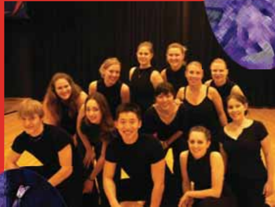
今回のメンバーです!

UWRFダンスチームについて 私達ダンスシアターはリバーフォールズ大学のダンスチームです。現在38人で活動しており、活動内容は、さまざまなイベントでのダンスパフォーマンス、大学内での5日間連続パフォーマンス、また全米規模のダンス大会にも参加しております。全員がダンス大好きなメンバーばかりで、それぞれが、いろんな分野のダンスに挑戦しています。(主にモダン、コンテンポラリー、フラ、ヒップホップ、ジャズ)メンバー全員が個性を持った自己表現力のあるダンスチームです。